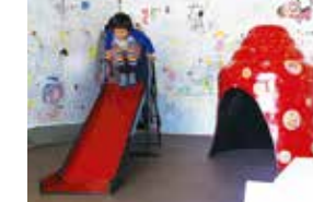
※画像は昨年の展示風景です

漆塗りの遊具にさわって、遊んで…。古くから日本人の身近にあった「漆」。自然素材の持つ心地よさは子供たちの五感を刺激します。 期間 ◆ 10月3日(土)～11月1日(日) 9:00～17:00 会場 ◆ 尚仲株式会社(七日町) C-2