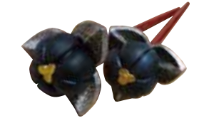
作: 吾子可苗「簪 椿の実」(2015)

協力 ◆ 吾子可苗、白岩有美、沼田英恵 会津で漆の作品を手がける女性作家3人にスポットをあてました。3人それぞれが表現する女性ならではの「たおやかさ」、新しい視点で現した漆のかたちをご紹介します。 期間 ◆ 10月3日(土)～11月1日(日) 10:00～17:00 ※火曜定休 会場 ◆ こはるかフェンショップ あいいる(七日町) B-2