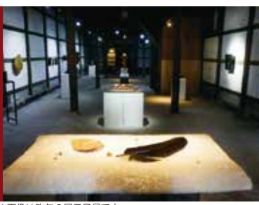
※画像は昨年の展示風景です

協力 ◆ 会津大学短期大学部、京都市立芸術大学、富山大学、東京藝術大学、金沢美術工芸大学、東北芸術工科大学、秋田公立美術大学、広島市立大学、宇都宮大学、筑波大学 期間 ◆ 10月3日(土)～11月1日(日) 会場 ◆ 松本家蔵(上町) F-1 9:00～17:00 芳賀家蔵(七日町) B-2 9:00～17:00 末廣酒造嘉永蔵(日新町) C-3 9:00～17:00