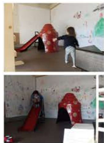
漆ドーム 漆すべり台 (会津短大プロジェクト)