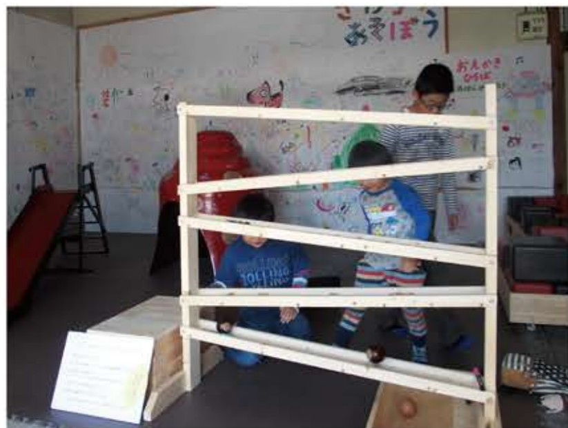
どんぐりコロコロ (大矢一成)

古くから日本人の身近で活用されてきた「漆」、自然素材が持つ魅力やぬくもりが、こどもたちの五感を刺激し、記憶として残る体験となりますように。