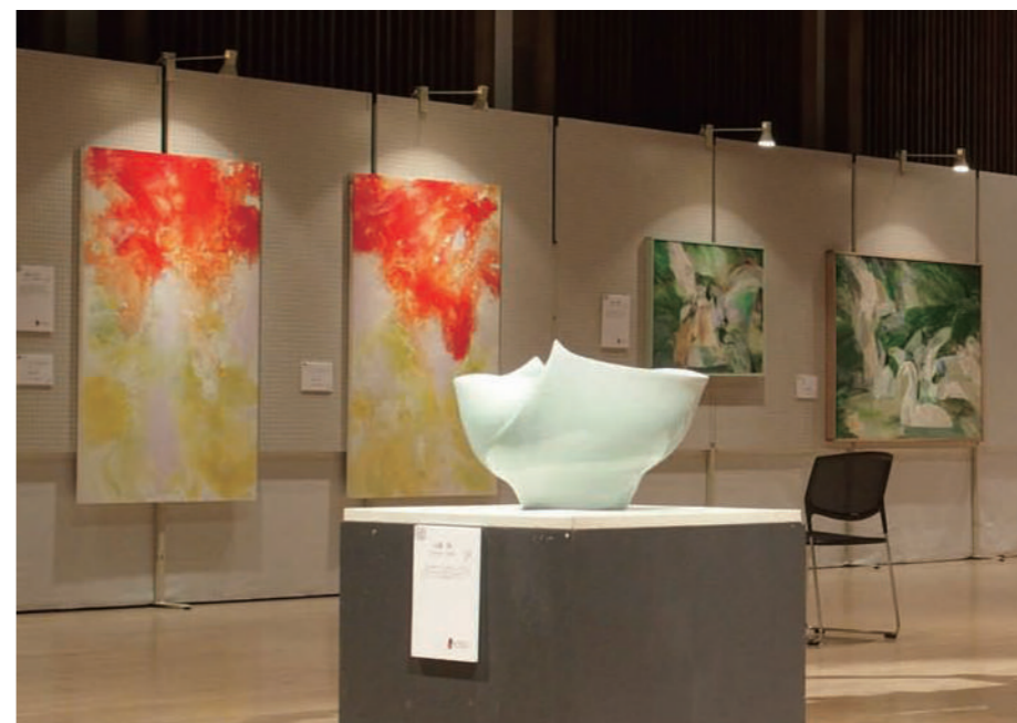
奥平面作品左より：イメージとしての器—須弥山—2014 (2点)、ムービングフォレスト、湖