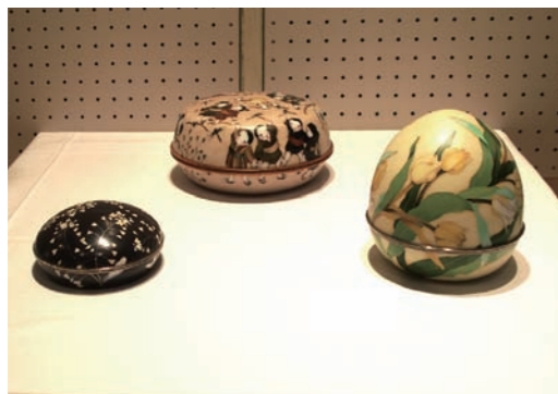
左より：撫菜、童遊び、鬱金香