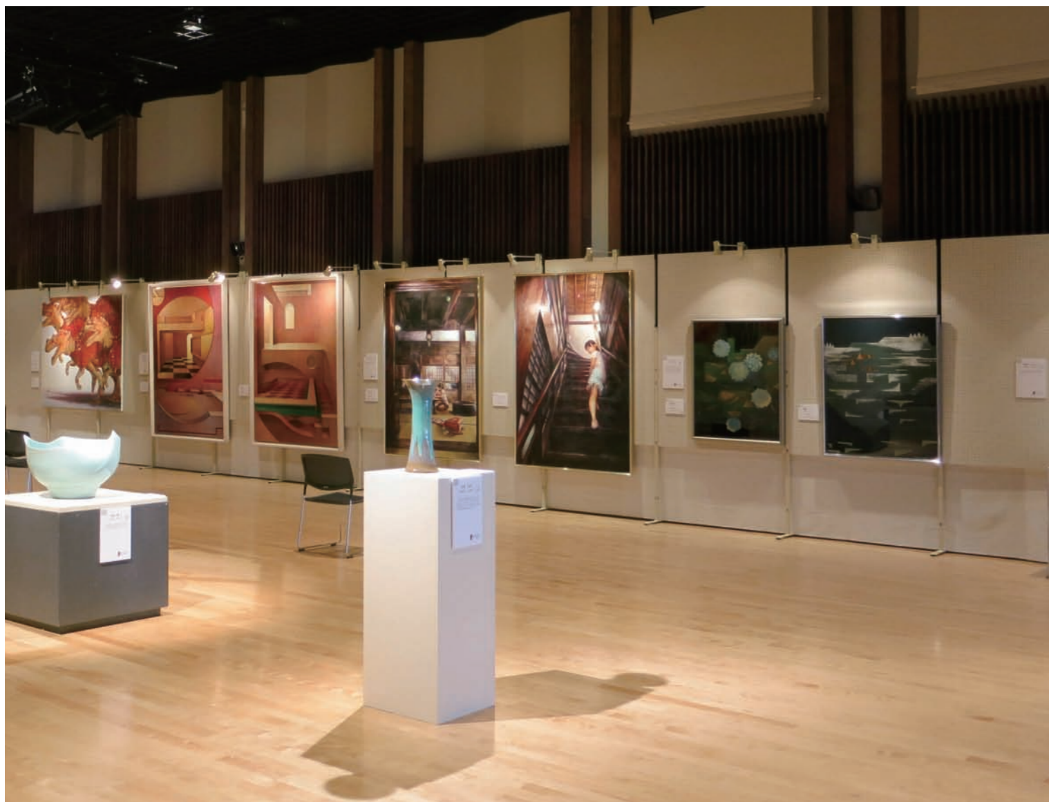
奥平面作品左より：琉群、Float I、Float II、オトノキオク・チャノマノアカリ、オトノキオク・ヒミツカイダン、雨のなか、蒼積

協力作家／青山ひろゆき、伊藤将和、遠藤悦史、小野仁良、後庵野かおり、小林徹男、近藤賢、 佐藤詩織、高橋克幸、照井克弘、根本春奈、宗像利訓、横田円佳、渡邊里絵香